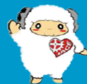
日本臨床工学技士会オリジナルマスコット シープリン